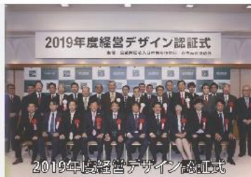
2019年度経営デザイン認証式