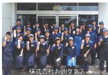
株式会社九州タブチ