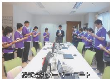
株式会社スーパーコート