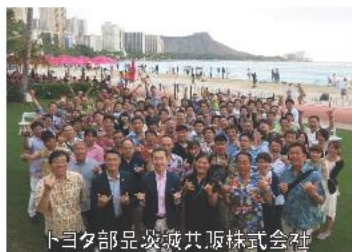
トヨタ部品茨城共販株式会社